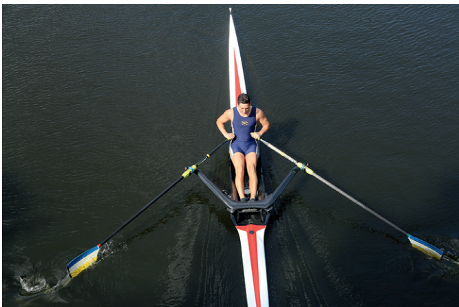
Ausheben: Am Ende des Durchzugs werden die Blätter senkrecht aus dem Wasser gehoben.

Sobald der Rollsitze zum Stehen kommt, sind die Blätter schon gesetzt. Die Blätter fallen mit großer Leichtigkeit und locker ins Wasser – wie ein Frühstücksmesser in die weiche Butter. Und zwar nur das Blatt, chirurgisch exakt und genau bis unter die Wasseroberfläche, der Schaft bleibt trocken. Dieses möglichst lautlose „Einkuppeln“ gelingt nur, wenn die Blätter zuvor voll aufgedreht sind und sie senkrecht ins Wasser fallen können.