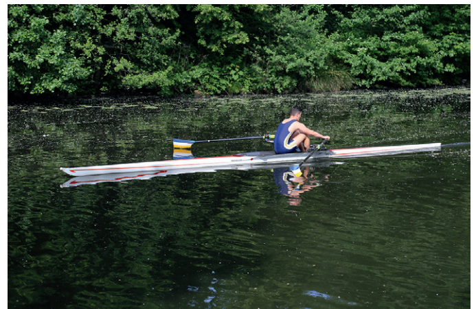
...das Aufdrehen beginnen, um die Blätter ohne Hast senkrecht