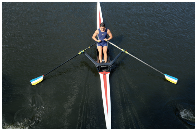
Freilauf: Anschließend werden sie in die Waagerechte geklappt und ebenfalls dicht oberhalb der Oberfläche zum Bug geführt.