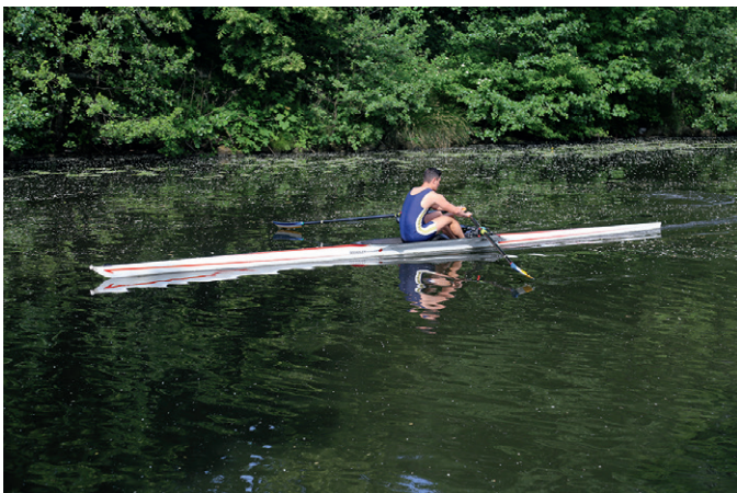
Aufdrehen: Sobald die Arme die Knie passiert haben, sollte

Abdrücken, wenn die Blätter noch nicht im Wasser sind: Oft eine Folge des zu späten Aufdrehens. Wenn die Blätter erst mit Beginn der Druckphase im Wasser aufgedreht werden, ist der Ruderer oft schon ein Drittel seines Rollweges gerollt, bevor die Blätter Druck aufnehmen. Lösung: Das Gefühl des „Einkuppelns“ stärken. Erst wenn die Blätter im Wasser sind vom Stemmbrett abdrücken. Nur zu Übungszwecken erst die Blätter im Wasser, dann abdrücken.