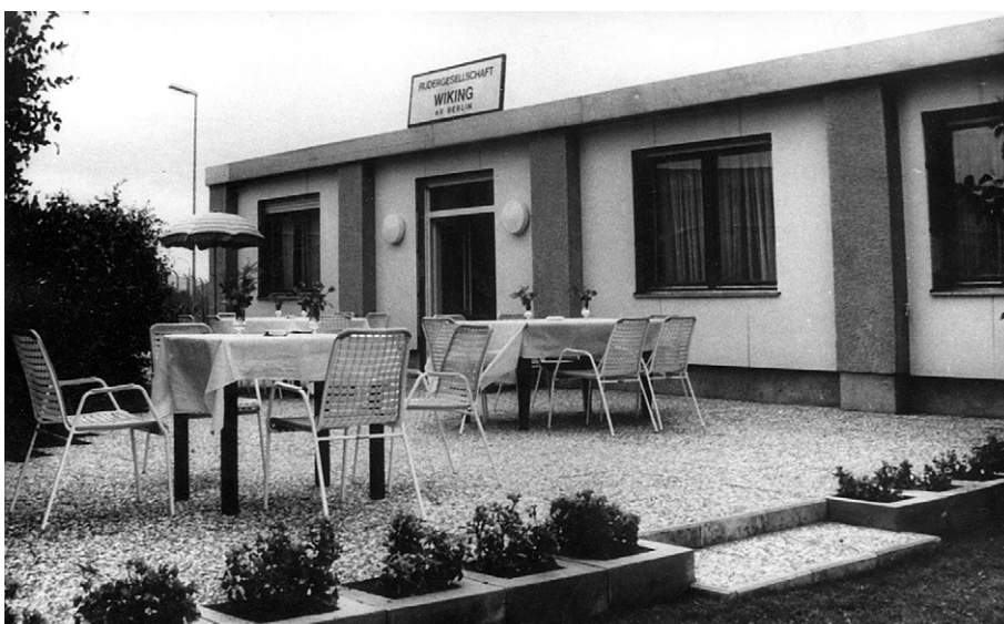
Terrasse: Das bescheidene Britzer Bootshaus mit der Bestuhlung nach dem Anbau von 1973.

B ei dem einen Ideengeber handelte es sich um Eugen Holy, der zu dieser Zeit als 36-Jähriger bereits seit knapp zehn Jahren der Union angehörte und seit 1890 auch deren 1. Vorsitzender war. Bei dem anderen handelte es sich um keinen geringeren als den schon damals als Multitalent geltenden Bootsbauer, Architekten und Schriftsteller Wilhelm Rettig, der bereits den Berliner Ruderclub 1880 mitbegründet hatte und im Jahr 1890 zur Union gekommen war, um dort als Trainer zu arbeiten.