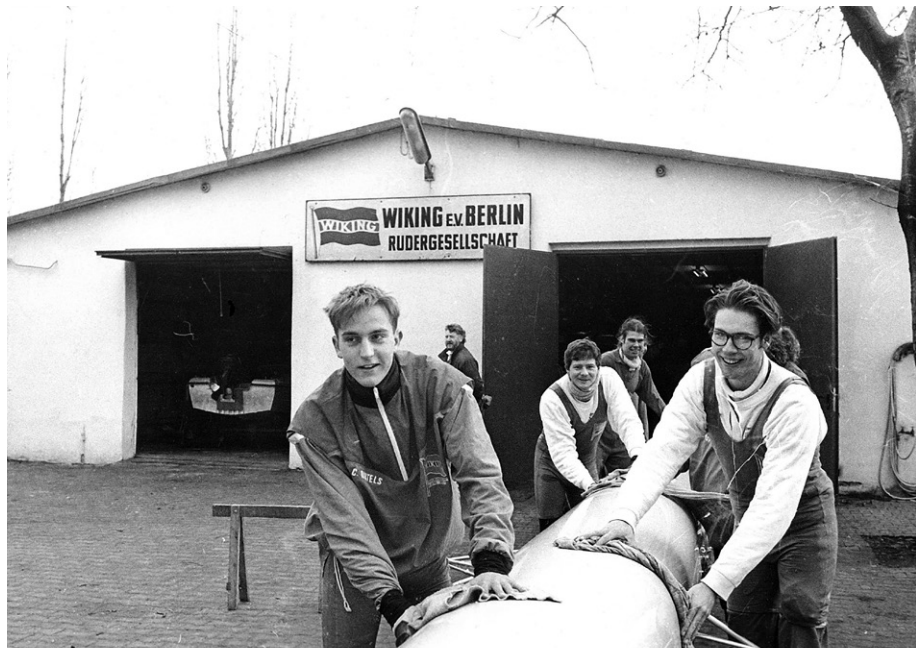
Bootspflege: Ruderer im Jahr 1995 bei der obligatorischen Bootspflege am Britzer Bootshaus von 1951.