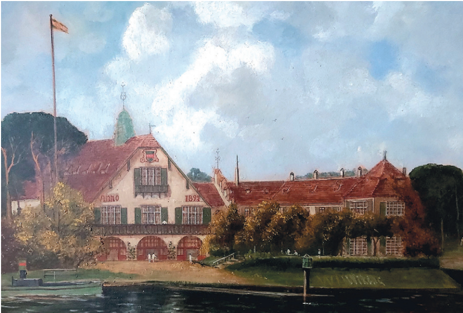
Gemälde: Das 1998 in Niederschöneweide eingeweihte Wiking-Bootshaus.